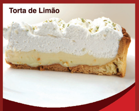
Torta de Limão