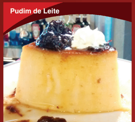
Pudim de Leite